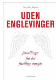
Grafik: 'Bramsen & Nørgaard'