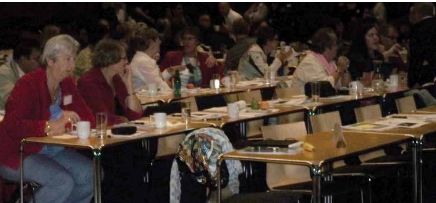
Interessen var stor fra de fremmødte, der her nyder kaffepausen.

"Arbejdspladsen har et ansvar for at udstikke klare retningslinjer. Og de frivillige har et ansvar for at gøre det klart,